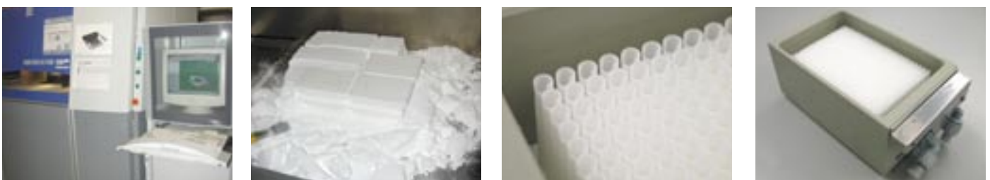
Bild 2. Produktionsablauf (lasersintern, auspacken, Montage, fertiger Waschblock).